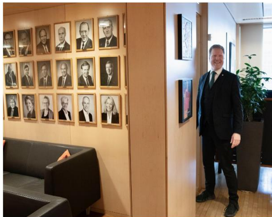
Kommunal- og distriktsminister Sigbjørn Gjelsvik (Sp) håper at flere kan ta del i ordningen med bygdevekstavtaler.