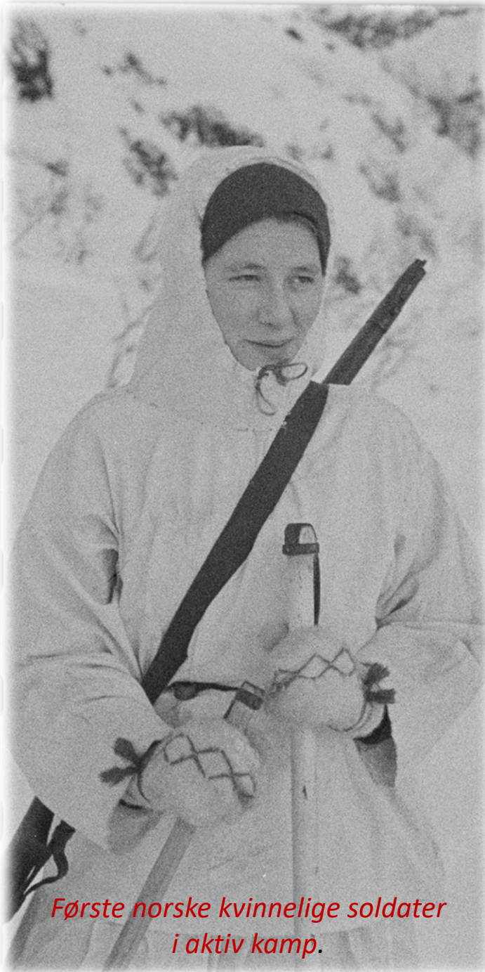
Første norske kvinnelige soldater i aktiv kamp.