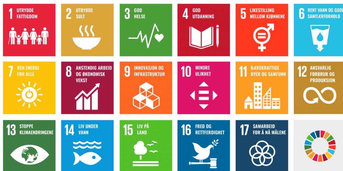
FNs 17 bærekraftsmål.

«Regjeringen har bestemt at FNs 17 bærekraftsmål, som Norge har sluttet seg til, skal være det politiske hovedsporet for å ta tak i vår tids største utfordringer, også i Norge. Det er derfor viktig at bærekraftmålene blir en del av grunnlaget for samfunns- og arealplanleggingen».